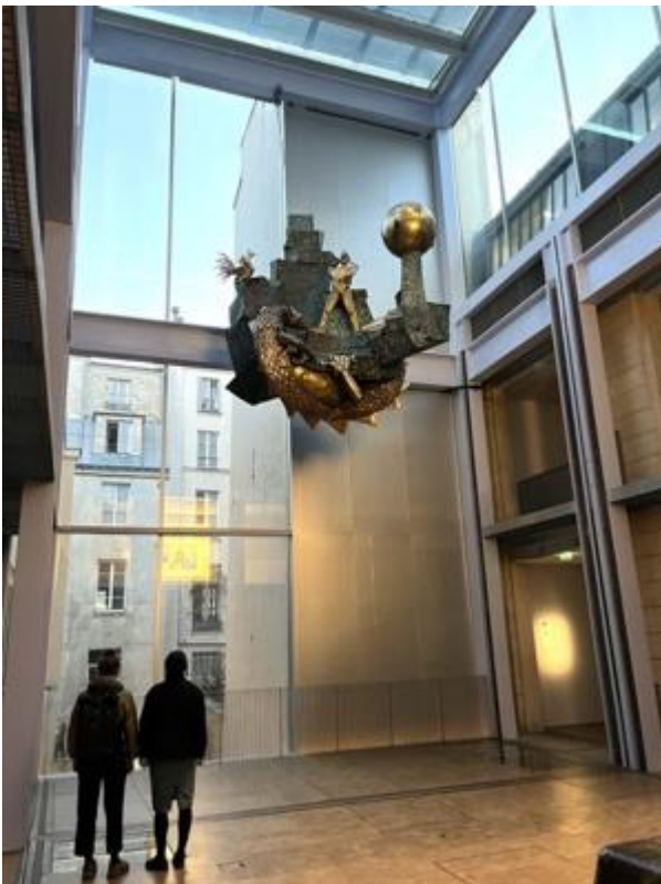
Le Défenseur du Temps exposé à Lafayette Anticipations en 2022.

Faute de financement pour son entretien, l'horloge est arrêtée le 1er juillet 2003 pour un temps indéterminé."